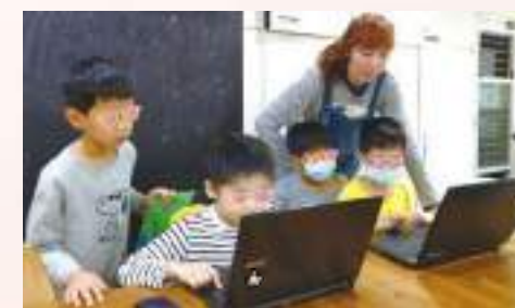
一起看品格小短片