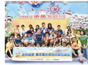
6/13 劍湖山一日遊 丞燕國際 / 忠義育幼院