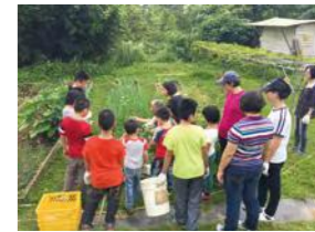
5/2 三芝開心農場 台北市鏢而協會 / 忠義育幼院