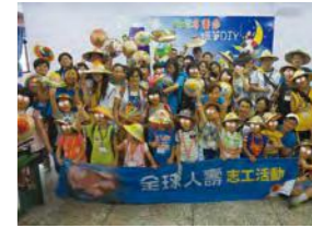
7/5 我的一畝田體驗 全球人壽 / 忠義育幼院 / 心棧家園