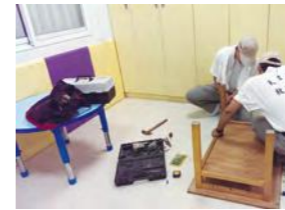
7/26 家園修繕服務 天理教志工團 / 桃馨園