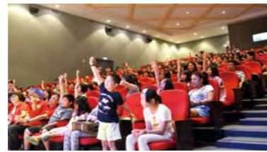
故事大盜兒童劇 - 努力搶答問題