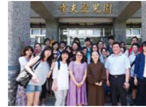
6/22 參訪幸友愛兒園、神愛兒童之家 忠義育幼院 / 心棧家園