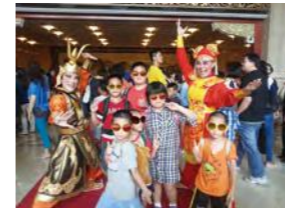
6/21 觀賞紙風車劇團表演 紙風車劇團 / 忠義育幼院