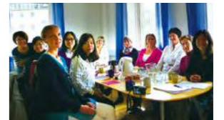
於哥德堡社會服務辦公室了解瑞典收養家庭的審核過程

恩恩，被收養時約4歲，有發展遲緩的議題，收養父母表示，回到瑞典後，孩子身邊的人都表示看不出孩子有發展遲緩。參加夏令營時約4歲3個月，已能用瑞典語說簡短的句子。