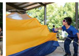
搭帳篷初體驗，看我架勢十足！