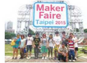
5/30 欣賞「Maker Faire Taipei 2015」展覽 台北市社子文教基金會 / Make 國際中文版 / 心棧家園