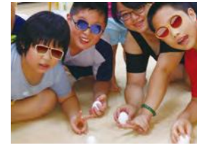
6/19 小家活動 - 端午節 DIY 香包及立蛋 忠義育幼院