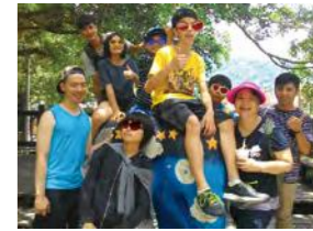
6/19 端午佳節同出遊 心棧家園