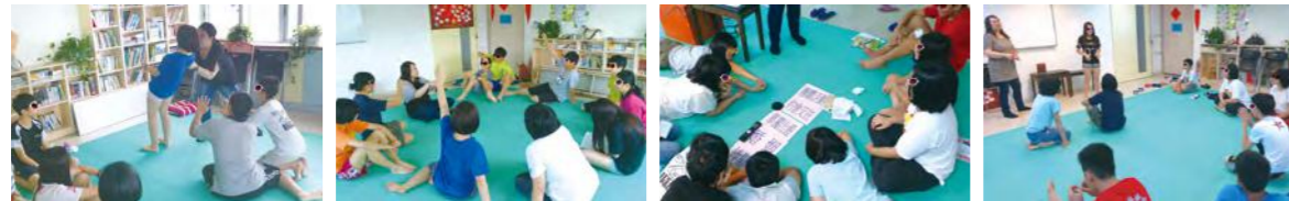
放心相信我們會撐住你

過程當中，經由老師深入的引導，孩子們重新學習了許多人際互動技巧，從如何向他人介紹自己，到如何瞭解他人、如何瞭解自己的情緒，以及練習讓自己容易被他人喜歡的小技巧，也體會了信賴別人的感受，進一步也讓孩子建立別人對自己的信賴，逐次的活動中孩子們增強了彼此間的良善互動經驗，為孩子成人後的人格，預先種下一顆正向的種子。