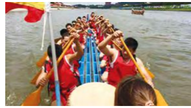
愛人家族「第二屆為愛而划」