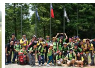
城市冒險全員集合出發！