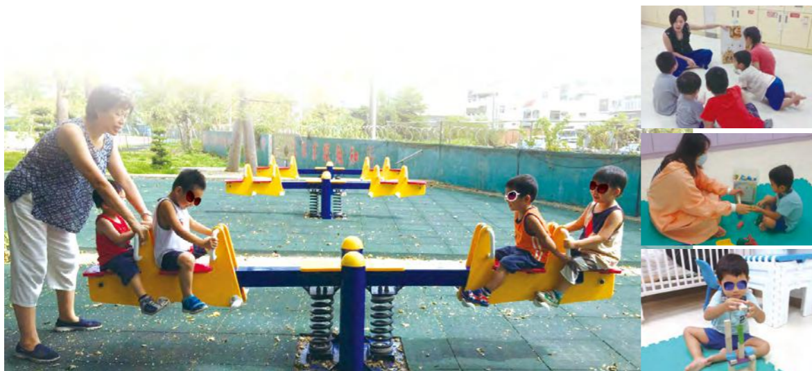
小王子在單獨的房間玩積木

社工是一份助人的工作，能夠看見需要受保護的孩子，從糟糕的情況中逐漸翻轉變好，重新開始新的人生，而我能從孩子身上得到回饋，即便只是簡單一聲「謝謝」，都會感動不已。相信這正是我在工作上的最大動力以及成就感。