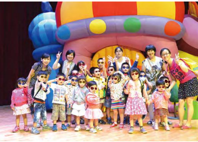
忠義育幼院的孩子觀賞兒童劇

民眾在觀賞後都覺得十分有意義，除了拉近全家距離，為彼此親情加溫。關懷失依兒，更是愛與被愛的具體學習，豐富了日常生活的意義。