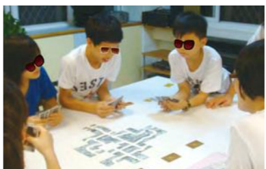
玩桌遊囉 - 嘿嘿輪到我了