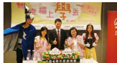
友邦人壽 - 伴學儀式