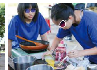
全神貫注準備大家的早餐，歐伊系~~