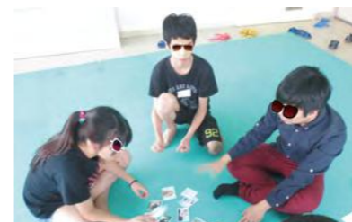
玩桌遊囉 - 暖身說明

心棧家園日前也使用桌遊為國中生舉辦一系列情緒輔導團體，讓國中生能從玩桌遊的過程中檢視自己曾出現的情緒，並思考討論如何進行調適，達到能在遊戲中學習和平相處目標。