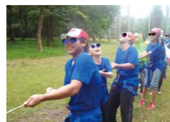
大擺盪活動，同心協力一起撐住夥伴。

經過這一個多月的籌備和營隊活動，每天都彷彿在兵荒馬亂中度過，有笑容、淚水、憤怒、挫折，然後找回自信，很希望能帶給孩子不一樣的回憶和充實的暑假，感謝孩子和夥伴們的努力，期許我們明年也有個不一樣的夏天。