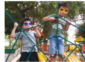
7/18 公園運動 / 桃馨園