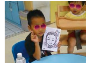
7/29 0 版人物畫 中華肖像漫畫家推廣協會 / 桃馨園