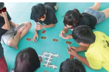
玩桌遊囉 - 該怎麼接呢