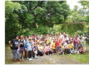
6/27 阿里磅農場探險 建國工程 / 忠義育幼院 / 心棧家園