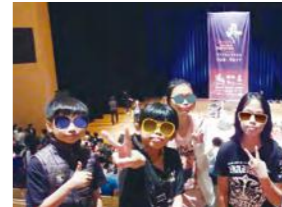
10/9 2015TIHF 十孔口琴以及爵士口琴獨奏會 財團法人劉戀文化基金會 / 榮蒂口琴樂團 / 心棧家園