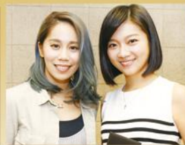
創作歌手劉軒藥與實力派演員傅小芸