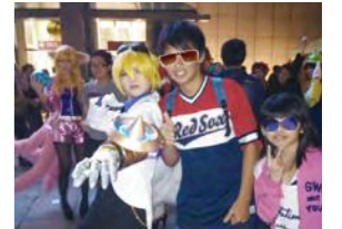
10/25 VGL 電玩交響音樂會 台北市政府社會局 / 心棧家園