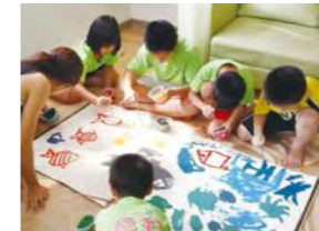
8/19 歡心家園彩繪 契爾氏 / 忠義育幼院