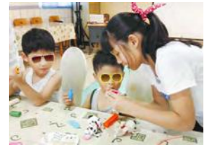
9/12 小小糖霜藝術家 震旦行 / 忠義育幼院