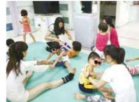
9/19 幼兒瑜珈 台灣國際瑜珈教育發展協會 / 忠義育幼院