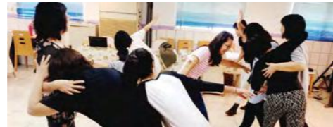
肢體互動帶領示範教學