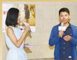
年輕新銳導演分享拍攝歷程