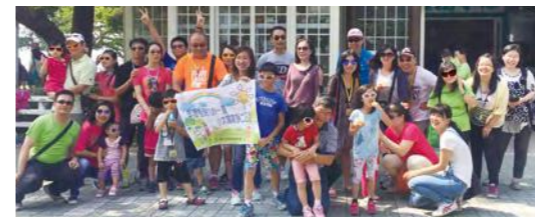
城市冒險全員集合出發！

許多收養父母分享他們和孩子都喜歡來參加本會活動，孩子從中能瞭解有許多人和自己一樣擁有兩個愛他（她）的爸爸、媽媽，也因此認識成為朋友。這次活動圓滿成功，看著許多印象中剛學會走路的孩子，如今已成為大哥哥、大姊姊，個性上更加穩定並且會協助照顧其他年紀較小的孩子，社工也不禁微笑的感嘆「孩子長大了！」看著這些幸福的笑臉，是我們工作中最大的價值。