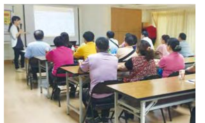
社工詳細解譯收養服務