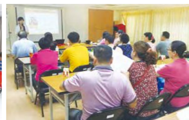
收養之愛 幸福啟航