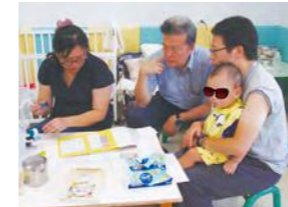
9/19 吉兒診所免費施打疫苗 吉兒診所 / 桃馨園