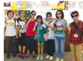
9/5 笑學堂 漢霖說唱藝術團 / 心棧家園