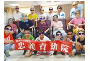
8/18 社會服務-參訪文山老人養護中心(日照服務) 文山老人養護中心 / 忠義育幼院