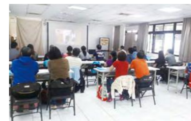
收養家庭藉由影片認識忠義服務