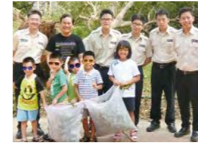
8/11 社區服務-打掃景華公園 / 忠義育幼院