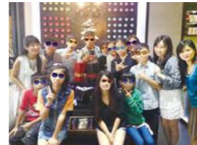
8/26 No.5 Caf'e 慈善午茶邀請 台灣菲拉格慕股份有限公司 / 忠義基金會