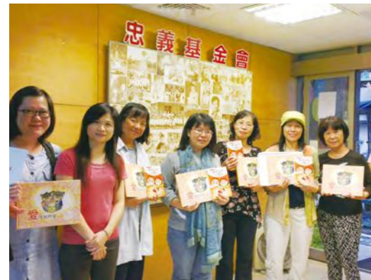
忠義愛故事花園的志工朋友們

忠義愛故事花園持續歡迎有經驗的故事媽媽（或爸爸）或喜愛與孩子互動的朋友參與，共同學習，創造具備生命影響力的「說故事」方式，深刻帶領、親近學童，就近發揮社區影響力，關懷與自己孩子鄰近的每一個孩子。