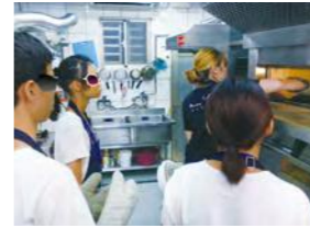
8/14 Miss V bakery 廚藝課 立賢基金會 / 心棧家園