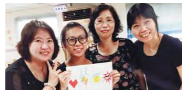
腦力激盪故事小組名稱“日月爭心”