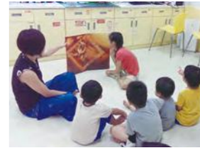
8/16 長庚醫起行志工陪伴 長庚醫院 / 桃馨園