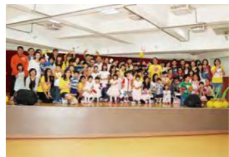
親愛的助養人們，下次再見囉