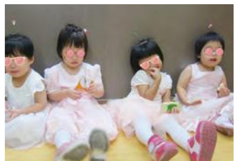
可愛的小妖怪們表演完都餓壞了