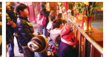
廟宇祈福，祈願新年大吉