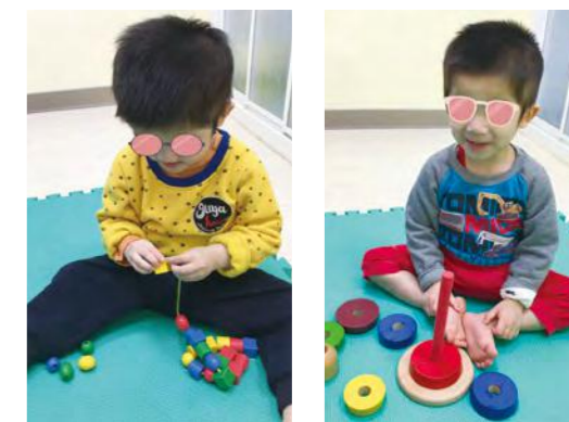
串出美麗的項鍊送給保育媽媽