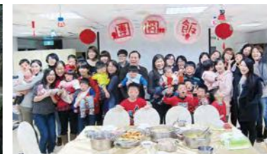
圍爐團圓飯，圓滿溫暖