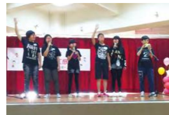
青少年演唱當紅歌曲小幸運