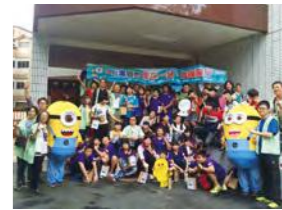
11/14 陽光活力節能趣 / 心棧家園 / 台灣電力公司