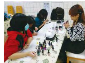
01/28 美甲活動體驗與職場介紹 / 心棧家園 / 台灣娜拉波股份有限公司