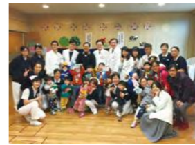
1/28 守護幼苗守護愛 - 愛的團圓 / 忠義育幼院 / 台北慈濟醫院