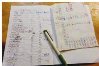
仔細記錄花費，當個理財小高手