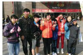
逛逛101好開心，超市購物真盡興