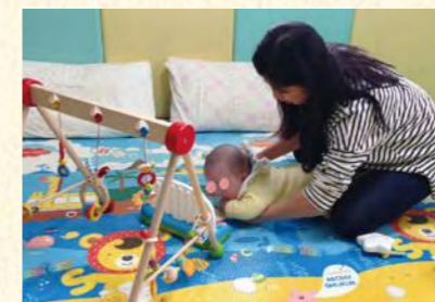
我們來練習翻身吧

常聽人說「黃金治療期」，您相信嗎？0到6歲發展階段的重要性，是黃金期、是發育期、是成長期、更是陪伴期。小兒復健師並非萬能，但能用專業陪伴照顧者與孩子，從旁給予協助。得到孩子的進步成長與照顧者的信賴認同，是令人相當歡喜與欣慰的事情，但我們真的不是萬能；只憑我們的努力仍無法讓孩子成長，只有照顧者與孩子共同相信，也和我們一起努力：不甘示「弱」，「勢」必累積「群體」的力量，不容小覷。