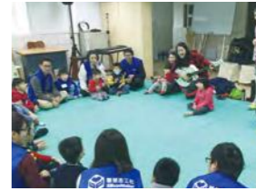
11/29 幼兒打擊樂活動 / 忠義育幼院 / 朱宗慶打擊樂蘆洲教室