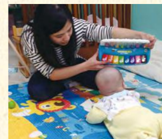
用色彩繽紛的鋼琴吸引孩子，練習抬頭