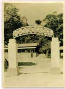
私立劉銘傳育幼院