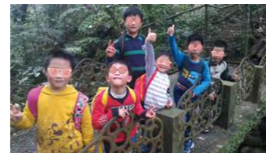
齊力登虎山，親近大自然

每當看見所有的孩子都能帶著笑臉進入夢鄉，即使再辛勞，也都值得了。童年的回憶無價，點點滴滴都彌足珍貴，腦海裡的記憶雖然可能逐漸斑駁，但是，如此幸福快樂的感受，必定會深植在孩子的心裡，伴隨著他們成長、茁壯、面對未來的挑戰。