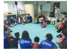
1/23 音樂體驗活動 / 忠義育幼院 / 慧榮科技 / 樂無休止音樂治療團隊