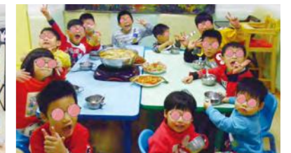
院童共享年夜飯，平安守歲