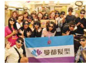
01/05 曼都義剪職涯參訪 / 心棧家園 / 曼都國際股份有限公司