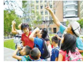
11/14 台大校園生態探索 / 忠義育幼院 / 鏗而生態親子協會