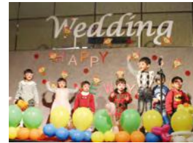
01/20 威剛尾牙 / 忠義育幼院 / 心棧家園 / 桃馨園 / 威剛科技