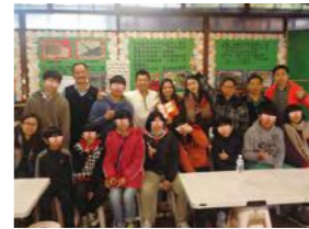
01/29 福田園農場一日遊 / 心棧家園 / 新加坡駐台北商辦事處