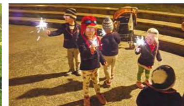
仙女棒閃閃亮亮，絢爛奪目