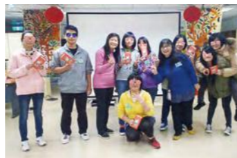
高中生領紅包，祝福滿滿慶新年