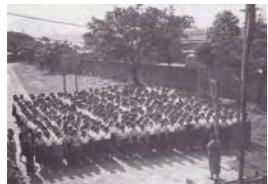
攝影於銘傳大學創辦地，為民國 40 年左右私立銘傳育幼院之舊址，亦即今日之台北圓山聯誼會。特別感謝銘傳大學提供歷史照片

銘傳大學創辦人包德明曾表示：為什麼以銘傳二字來為學校命名呢？第一，因為先賢劉公銘傳於清末至台，築鐵路、興水利、創學校，修武備，為台灣奠定了現代化的基礎，其功績實不可沒；而其刻苦耐勞、堅毅不拔的精神，尤足為現代青年的楷模；第二，本校園址原為紀念劉公的一所育幼院，我們不忍也不能讓一位為我景仰而功在國家的先賢，沒有一點紀念，所以決定用「銘傳」來命名本校，以表崇敬，同時，也可顧名思義，繼承他的刻苦、堅毅不拔的創造精神來從事奮鬥。（本段落文字編撰自《銘傳三十年》年鑑，原為銘傳大學創辦人包德明紀念創校 30 年而作）