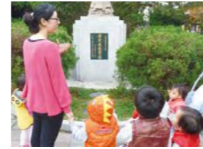
1/10 校園巡禮（認識至聖先師 - 孔子）/ 桃馨園