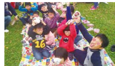
公園草地野餐，舒適愜意