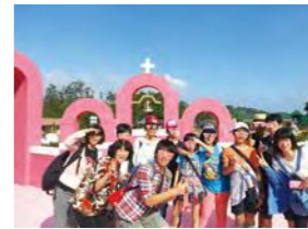
11/08 104 年西湖渡假村烤肉公益聯誼活動 / 心棧家園 / 南亞塑膠公司