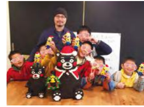
12/26 堆砌童趣 歡樂積木 GO / 忠義育幼院 / 積木創意堆砌