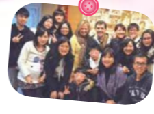
正式接返與伙伴合照