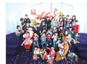
12/18 聖誕午餐聚會 / 忠義育幼院 / 心棧家園 / Wedding day