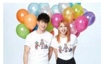
「holding hands」公益 T 恤助養贈禮