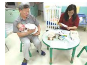
1/18 疫苗施打 / 桃馨園 / 吉兒診所