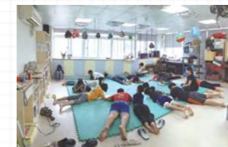
孩子們正思考要如何向夥伴介紹自己的怪獸。