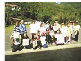
11/5 頭城農場一日遊 / 心棧家園 / 湯泉社區