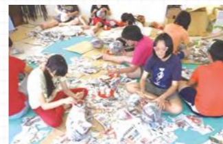
孩子們正塗塗抹抹黏報紙，準備製作屬於自己的小怪獸。

未來，基金會將持續與心棧家園攜手，結合生涯輔導的理念，並以孩子的需求為出發點，規劃更多元化的課程，提供孩子不一樣的思維和視野，為孩子們的職涯作準備。