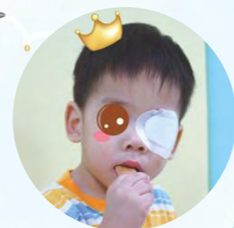
視力矯正中的我， 依然開心吃餅乾呢！