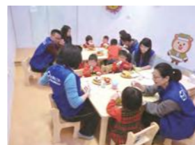
1/21 奧斯丁樂團 / 忠義育幼院 / 慧榮科技