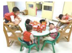
12/24 陪過耶誕節 / 桃馨園 / 長庚志工團