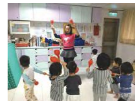
1/14 鬆餅姐姐說故事 / 忠義育幼院