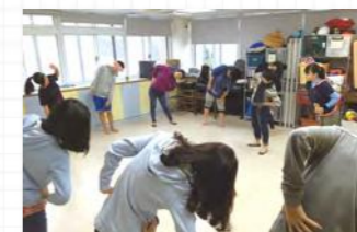
老師帶領孩子們在舞蹈和表演前動一動以舒展筋骨。