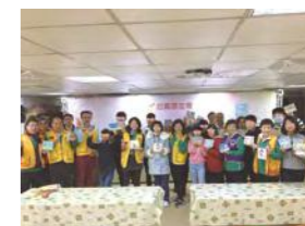
1/14 獅子會蝶谷巴特餐會 / 心棧家園 / 國際獅子會 300-A2 區