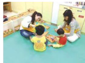
11/22 行動親子車 / 桃馨園 / 桃園市政府社會局