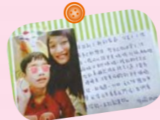
保育媽媽手作紀念品