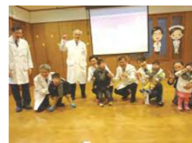
1/25 歲末感恩活動 / 忠義育幼院 / 台北慈濟醫院