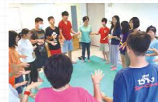
老師請孩子們圍圈，互相認識彼此。