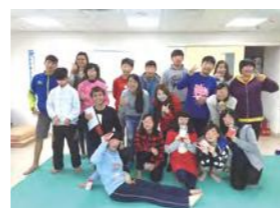
1/21 華陽扶青團爐 / 心棧家園 / 華陽扶青團