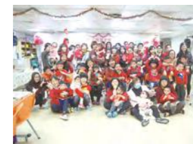
1/20 歲末圍爐 / 忠義育幼院