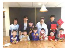
12/17 樂高益智活動 / 忠義育幼院