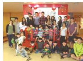
11/27 郭元益蛋糕製作 / 忠義育幼院 / 美國學校