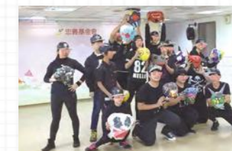
孩子們透過數週緊密的練習，在成果發表會帶來精彩的演出。