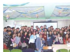
1/24 心棧歲末圍爐 / 心棧家園