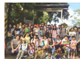
11/19 登高遠望賞群山 / 忠義育幼院 / 心棧家園 / 建國工程