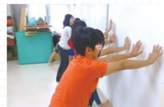
透過推拉練習來學習孩子們控制自己的身體與掌控力量。