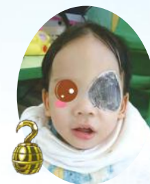
哈囉！我是家園最帥 的海盜王唷！