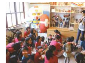
11/12 台灣玩具博物館 / 忠義育幼院 / Club 21