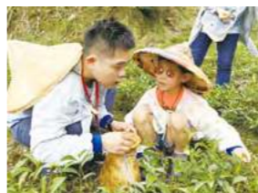
7/07 「我的一杯茶」採茶體驗 / 忠義育幼院 / 全球人壽