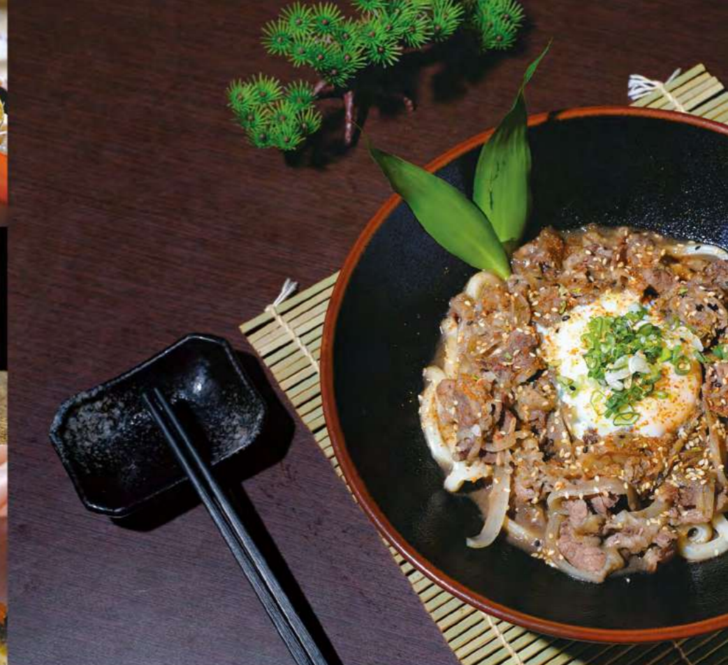
文◎資發組企劃 周孜穎

在料理檯後方，剛屆而立之年的老闆小傑，正用乾淨俐落的刀工選材：干貝、生蠔、蟹膏、甜蝦、生魚片……撐起一碗碗華麗海景丼飯料理的鮮度與美味。除了生魚片丼飯，還有老少咸宜的熟丼飯、串燒、手卷及握壽司。喜歡日本料理的朋友們，若有機會前往內湖湖光市場附近，一定別錯過這一份只有味蕾最懂的真情款待！