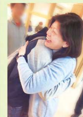
忠義基金會執行長

義行可風，衷心祈願越來越多的社會大眾，願以仁義樂善之心，來愛狂風暴雨期的大孩子。