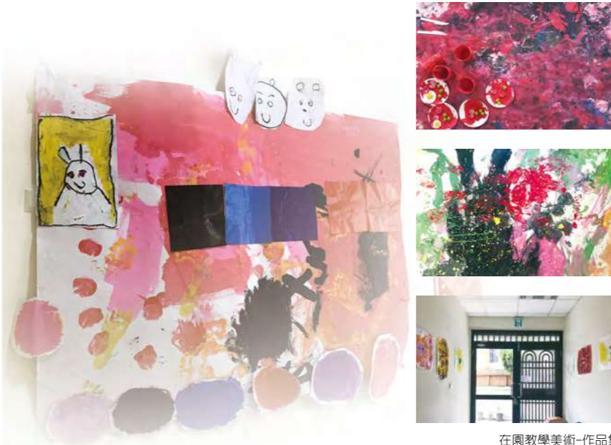
在園教學美術-作品集

我想，生長於不同類型環境之孩子，最基本需求就是內心渴望關愛及一直被愛之踏實感，而身為大人的我們，能給予孩子的，就是修復原生家庭帶來的無形傷害，並小心翼翼守護那顆純真的心，還給孩子們原本的笑容及天真：盡情用歡樂的笑聲、想像力，無限的揮灑一片更美好的天空。