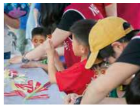
5/5 帶我尋家趣園遊會 / 忠義基金會 / 慧樂科技