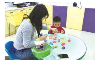
在園教學美術-製作小蛋糕、小點心