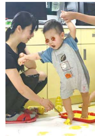
在園教學美術-沾滿顏料的小腳丫子

看著家園人力有限情況下，家園老師與社工們仍溫柔、耐心地照顧與守護，灌溉這些孩子滿滿的愛與關懷，並視園童之個別需求連結不同的外部資源，例如：早期療育到宅服務、透過幼教專業教師至家園服務之在園教學方案、情緒支持之舞蹈治療團體方案及感官刺激課程，園童逐漸適應環境與學習刺激，我慢慢發現孩子們的笑容變多了，放鬆的程度亦越來越好，開始有了更多第一次嘗試，不論孩子們在發展、社會與人際互動方面皆有明顯的成長與進步。