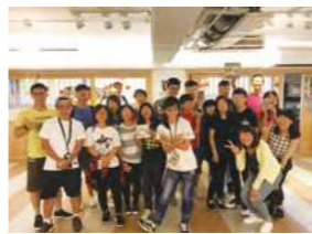
5/27 教會集遊趣 / 心棧家園 / 台北國際基督教會