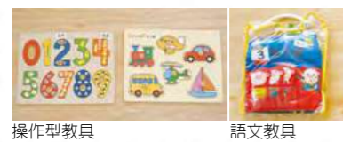
操作型教具 語言教具