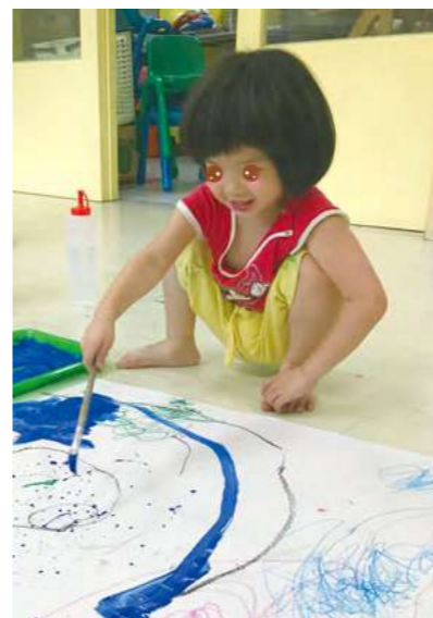
在園教學美術-我的甜甜圈

相較之下，家園孩子除被強迫帶離原生家庭，亦得與原本的生活暫時築一道牆，重新接觸一個不熟識環境與建立關係，發現沒有熟悉的面孔及環境，自我防衛按鈕自行啟動，缺乏安全感之內心開始呼叫渴望被愛之警訊，開始會有偏差行為與負面情緒等議題，特別是年齡幼小的園童在情緒起伏波動方面更是明顯。然而，有趣的是，每次觀察剛入住幾天的孩子上課，孩子在各自之生命歷程裡創作出獨一無二的表達方式，例如：一上課就嚎啕大哭、無法與人來往回應，趴在地上、希望有人抱著他、主動討抱，還有做任何事情都感覺有點膽怯，不敢下筆、不敢動，即使家園老師在一旁陪伴與鼓勵，仍會用高敏感度的雙眼掃射四周的環境及人的表情變化。