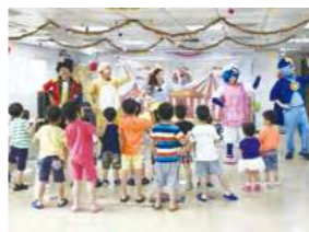
5/20 台灣親子劇 / 忠義育幼院 / 心棧