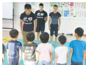
7/08 武甲兒童柔術 / 忠義育幼院 / 武甲武術