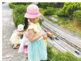
5/23 小人國 / 桃馨園自辦