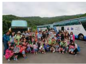
6/2 舊草嶺古道 / 忠義基金會 / 建國工程