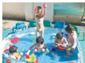
7/17 夏日樂游 / 桃馨園自辦