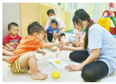
小肌肉及專注練習