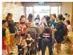
7/20 消防演習 / 忠義育幼院自辦