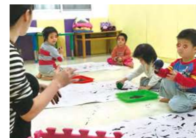
在園教學美術-利用球類滾出繽紛色彩