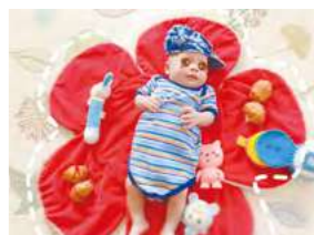
8/17 滿月桃 / 桃馨園自辦