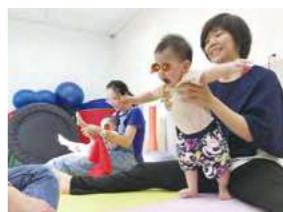
8/13 感官探索樂 / 桃馨園自辦