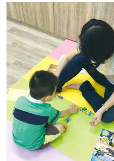
拼出自己的生命圖

心」及「不安全感」全開，成為團體生活變調的一個小麻煩，也常常讓大人們的神經快要斷線。然而，事實上一個被原生家庭不當對待的孩子，除需要更多的刺激、更多的跟人互動的機會去慢慢補足空缺的力量，亦需要更多的體諒和耐心等待：請體諒因為難受而大哭大叫的孩子，並同時理解孩子的情緒，當孩子有足夠的安適感後，就會開始有良好的對外探索與互動。