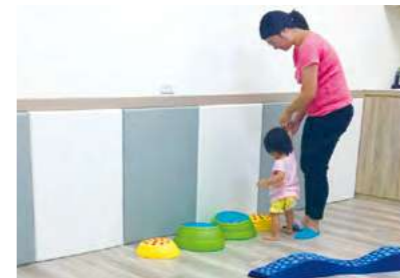
攜手勇敢跨出一步