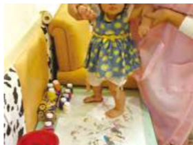
8/31 小腳腳印畫 / 忠義育幼院自辦