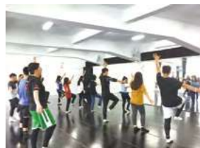
10/20 貴子坑一日遊 / 心棧家園 / 建國工程

由於您的支持與鼓勵，孩子們才能健康、快樂的成長，也因您熱情的參與，孩子們的生活更多采多姿。孩子的潛力是無限的，藉由各種活動的安排，可以增進學習的興趣與潛能的開發，更能讓孩子擁有不一樣的人生。