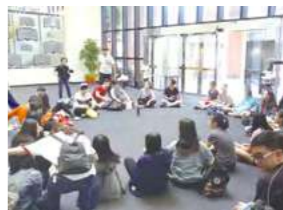
10/7 E7PLAY 電玩體驗 / 心棧家園 / 美國學校