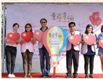
匯集各界愛心讓希望和夢想飛揚