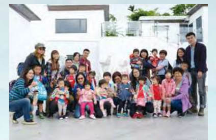
觀賞美術館的大型雕塑