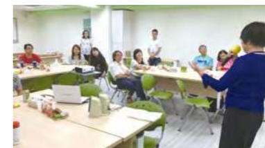
收養人進行收養歷程的分享