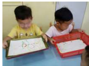
9/3 滾珠畫 / 忠義育幼院自辦