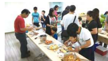
收養家庭各自準備一道菜，一同分享交流

我們始終相信「愛」能夠改變一切，給予彼此時間與空間適應新的角色與有了彼此的生活，調整對彼此的期待，遇到困難時，善用資源、與相關專業人員討論，都能使彼此能更堅定且勇敢的面對。