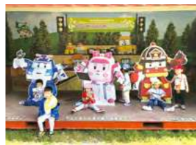
10/26 樂農莊 / 桃馨園自辦