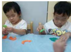
9/7 黏土遊戲 / 忠義育幼院自辦