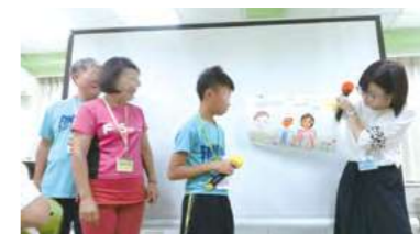
收養人與孩子一同上台分享畫作2