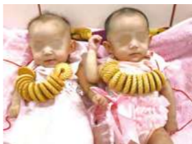
8/4 收涎 / 桃馨園自辦