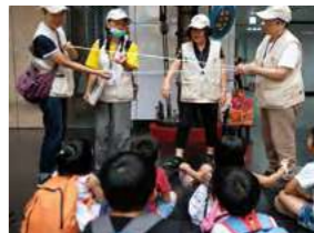
9/15 台鐵 + 飛飛 / 忠義育幼院 / 台鐵