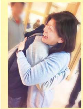
忠義基金會執行長

歲末年終將至，祈願我們曾經照顧陪伴的孩子及每一位曾經幫助我們的好朋友，平安健康、持續相愛。