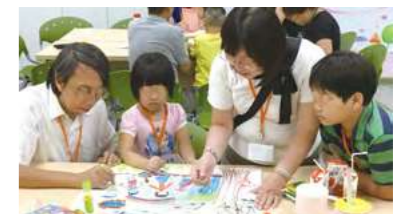
收養人一家進行共繪「我們這一家」