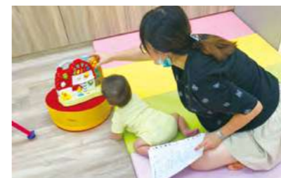
共同探索感官世界