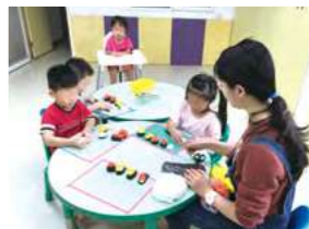
10/22 在園教學 / 桃馨園自辦