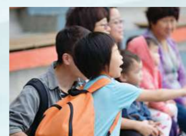
跳水的叔叔好厲害