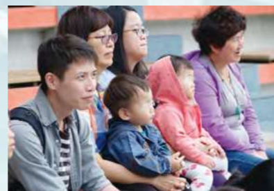
陪伴院童凝神觀賞海獅表演