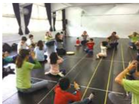
10/20 貴子坑一日遊 / 忠義育幼院 / 建國工程