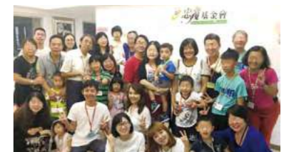
活動結束後大家一起開心的合照