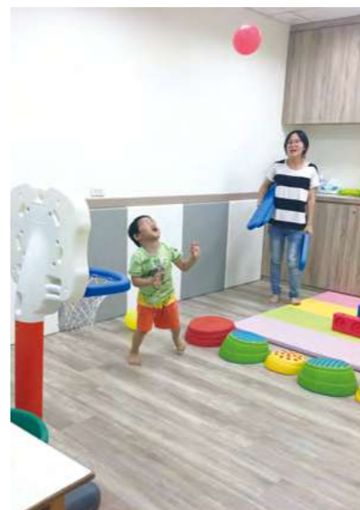
用自己的力量去拋向更美好的未來

在安置家園經評估園童有發展遲緩情形，並帶至醫療院所接受早期療育課程中，我發現緊急安置的孩子因為生活歷程或環境、照顧者時常轉換等因素，導致孩子的情緒變得容易起伏及愛生氣，只要稍微被制止就倒地大鬧變得情緒非常敏感，對於陌生人更是「警戒