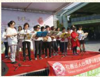
愛分享公益慈善會烏克蘭麗班演出