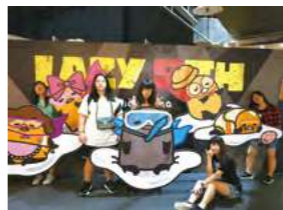
9/24 國畫哥展 / 心棧家園 / 飛躍 / 文創