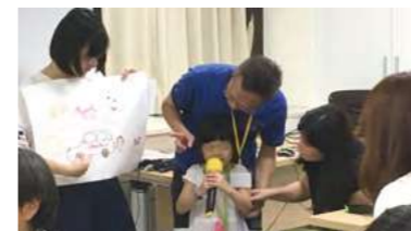
收養人與孩子一同上台分享畫作1