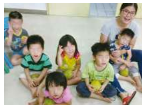
9/24 歡度中秋 / 桃馨園自辦