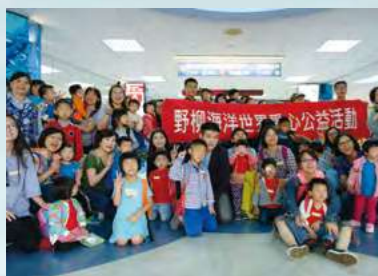
野柳海洋世界贊助公益門票