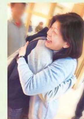
忠義基金會執行長

陪伴失依兒一起「回到，未來」吧！仍在安置家園中的 0-18 歲孩子，著眼當下，覺得心裡苦痛時，要不斷告訴自己「一定會過去的」。勇敢向前，去想像一個可以日日幸福的未來！