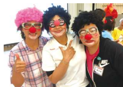
居服員訓練-小丑關懷協會