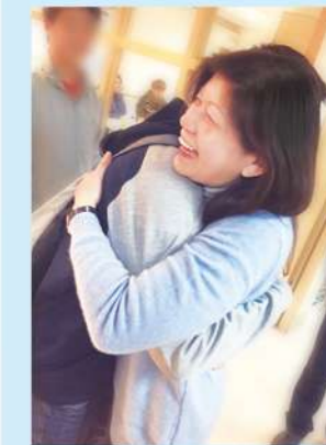
忠義基金會執行長

本期收錄了大孩子 10 月間的旅行記憶，總是渴望自主的青少年對小家出遊評價極高，樂見夥伴用心聆聽孩子的心聲並揣摩家庭親子關係中的良善互動。突破團體生活中的侷限並不容易，但一顆顆願意不斷嘗試與除錯心，孩子會感受得到。歲末年終，特別感謝疫情停擺後願意回流的諸多善意，祈願一起攜手，跨越 70！