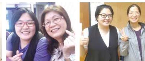
立珊與敏足執行長