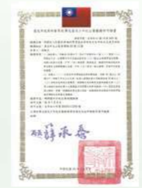
2005開辦國內外收出養服務