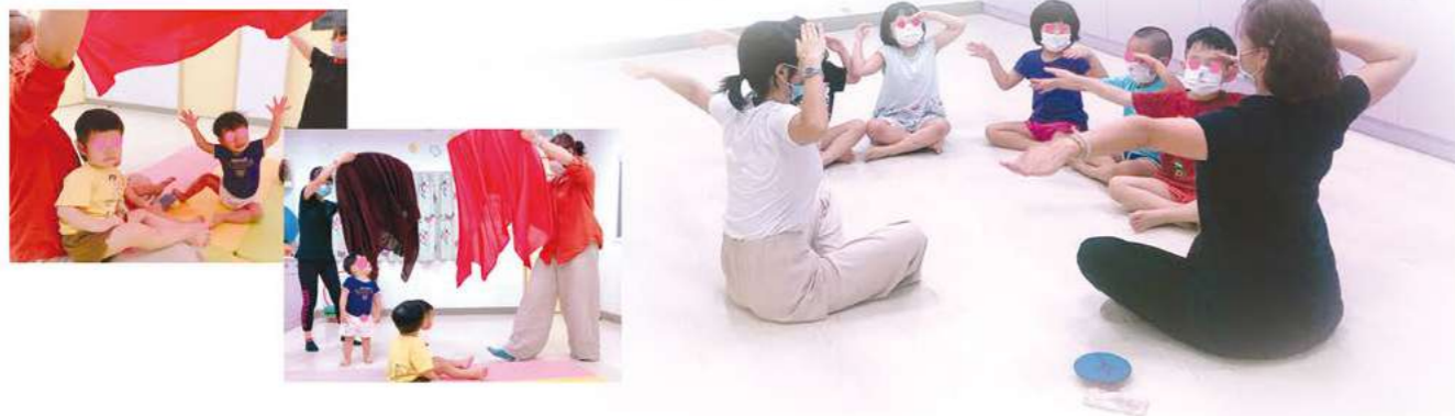
文◎徐菁蓮。舞蹈動作治療師暨戲劇治療DVT取向實踐者

「還不會說話、哭鬧到不行的寶寶能參加嗎？」「很分心、跑跳亂衝的跳跳虎，進團體會不會很干擾？」我們不斷思索舞蹈動作治療（Dance Movement Therapy）能如何運用身體動作經驗，增進孩童的生理、情緒、認知和人際關係，從他們最擅長又謎樣的身體動作和聲音表情中，編織出內外世界的資訊平台，體現藝術治療的創造性與包容度，找到生命韌性與復原力。