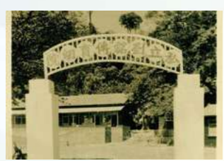
1951忠義育幼院成立，幫助難胞失依貧困兒童

「給棄嬰或受虐兒一個重生的機會」，第一次將這句話說出口的時候，我們擁有豐富而專業的經驗值並且已做足準備。從收容第一個兒少保護個案至現在承擔諸多緊急保護安置個案，我們看見孩子的需求，絕不僅僅在家庭遇到困難當下。