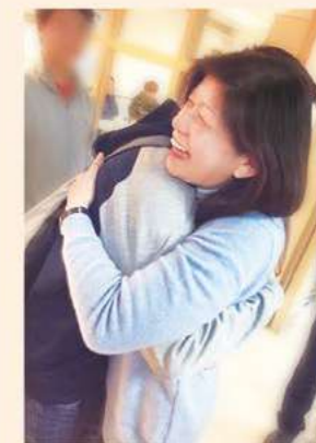
忠義基金會執行長

曾經，我們展開雙臂讓每一顆無處安放的受傷心靈停留於此，修復並成長。如今，在疫情尚未明朗化的此刻，渴盼各界持續與我們攜手守護：讓每一份想要長大的勇氣，無論現在未來，都能被妥善安放於獨一無二的人生舞台。