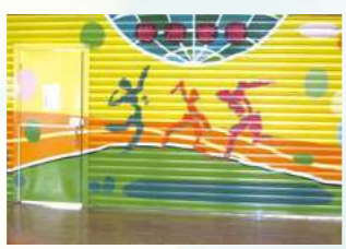
2005開始承辦台北市兒童緊急短期庇護中心「綠洲家園」