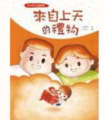
2014出版「來自上天的禮物」收養主題故事書