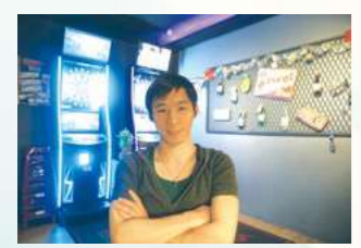
1989收容第一個兒童保護個案(阿莠)