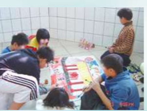
2014榮獲全國基金會評鑑優等