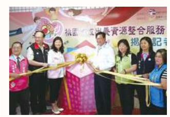
2016辦理桃園市收出養資訊整合中心