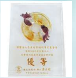
2014榮獲全國基金會評鑑優等