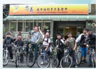
2004改組成立全國性基金會