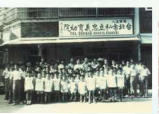
2005開始承辦台北市兒童緊急短期庇護中心「綠洲家園」