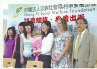
2005設立青少年中長期安置機構「心棧家園」