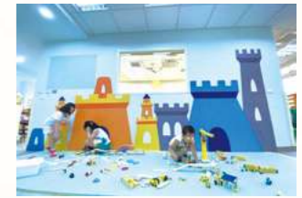
2011承辦桃園縣兒童緊急安置家園