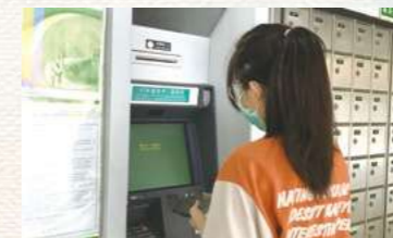
財務管理與應用能力-ATM操作