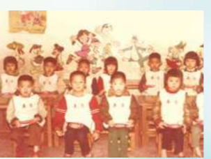
2004改組成立全國性基金會