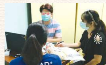
結案自立前內部準備討論