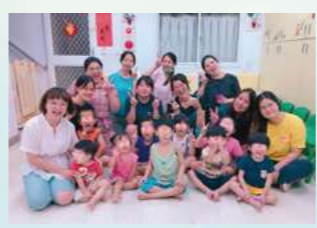
2011承辦桃園縣兒童緊急安置家園