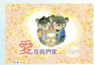
2013出版「愛在我們家」收養身世告知親子繪本